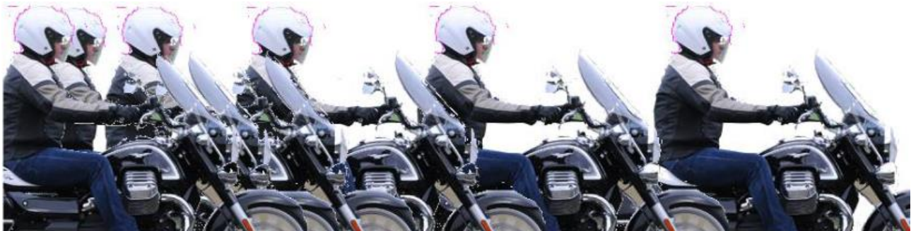
Chronophotographie d'un mouvement rectiligne et accéléré