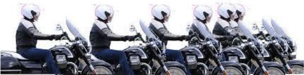
Chronophotographie d'un mouvement rectiligne et ralenti