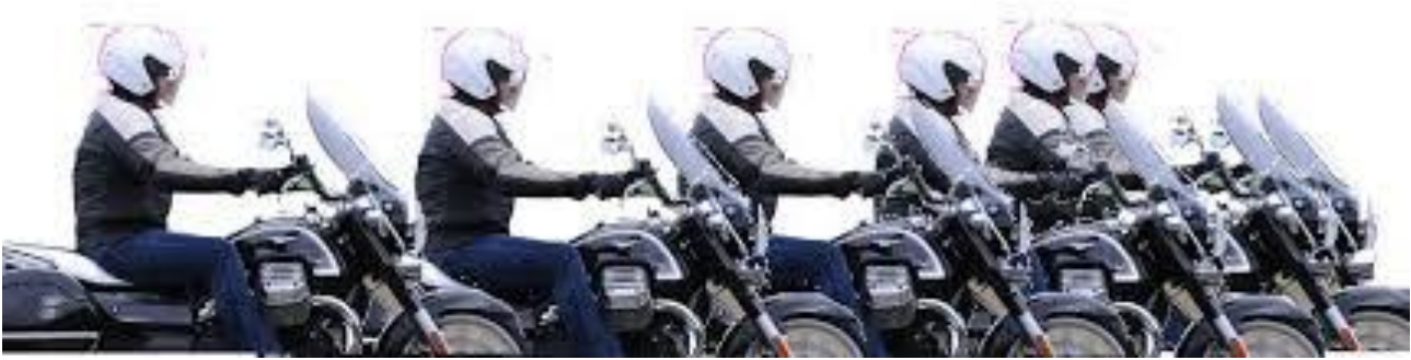
Chronophotographie d'un mouvement rectiligne et ralenti