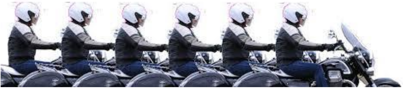
Chronophotographie d'un mouvement rectiligne et uniforme